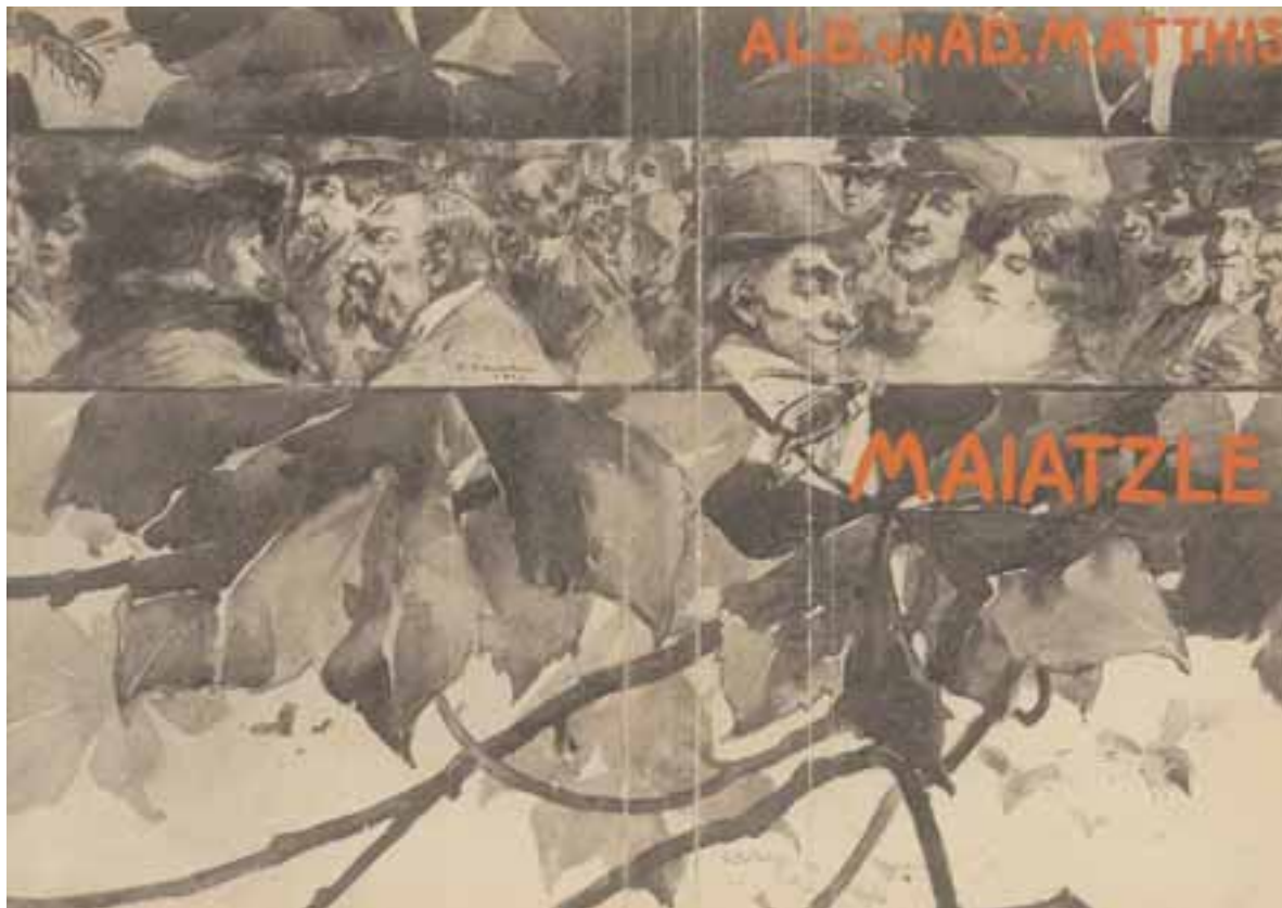
Couverture intégrale de Maiatzle par Émile Scheider et Georges Rittleng, 1903.

1958 Bissali = Bissali , augmenté d'un choix d' Aephai , de Fülefüte et d'inédits pour le 35 e anniversaire de la première édition avec une Introduction et des Notes par Alfred Schlagdenhauffen, Strasbourg 1958. Publications de la Faculté des Lettres de l'Université de Strasbourg, en dépôt à la Société d'édition des Belles Lettres 95, boulevard Raspail Paris VI e .